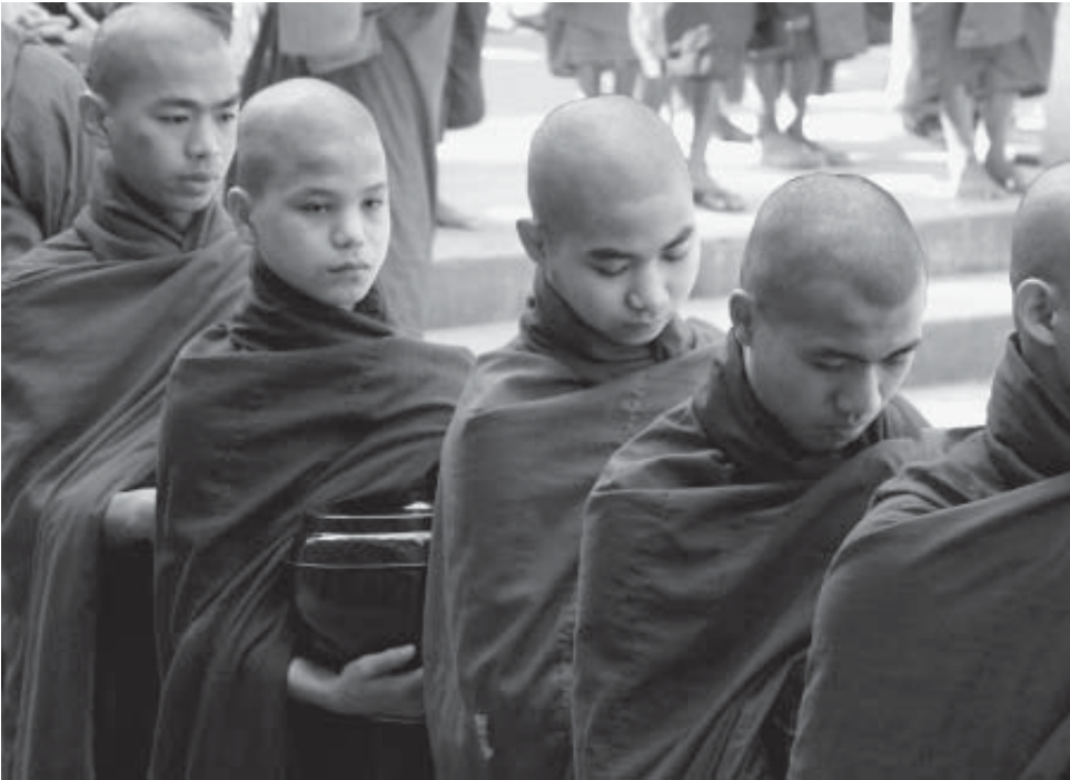
Mönche beim Almosengang: In Asien kümmern sich die Ordinierten um den Dharma, die Laien stellen die materiellen Grundlagen für den Orden bereit.

Der Buddha wies den mittleren Weg der Genügsamkeit. Es sah nicht die extreme Askese als Vorteil für das Erwachen an. Dies trug den Buddhisten den Spott der Jainas ein: „Ein weiches Lager, früh beim Aufsteh'n dann ein Trunk, mittags die Mahlzeit, abends wieder was zu beißen, bei Nacht noch Süßigkeiten und zum Schluss Erlösung, so hat's der gute Śākya-Sohn sich ausgeheckt.“