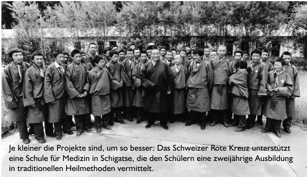
Je kleiner die Projekte sind, um so besser: Das Schweizer Rote Kreuz unterstützt eine Schule für Medizin in Schigatse, die den Schülern eine zweijährige Ausbildung in traditionellen Heilmethoden vermittelt.

Spätere Entwicklungsprojekte in Tibet vermieden zwar diesen Fehler der Deutschen, Probleme gab es aber trotzdem. Im Jahre 1988 schickte der British Council , ein Organ der britischen Regierung, zwei Lehrer zur Einrichtung eines Lehrerausbildungsprogramms für Englischlehrer an die Universität von Lhasa. Im Jahre 1989 mußte das Projekt eingestellt werden, da eine der beiden britischen Lehrbeauftragten aufgrund fehlender Unterstützung der chinesischen Behörden ihre Mitarbeit kündigte. Das Projekt habe, wie sie sagte, nicht dazu gedient,