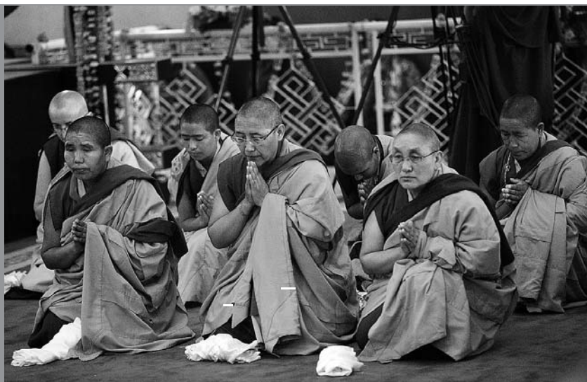
Stellvertretend für alle teilnehmenden Klöster bitten sieben Nonnen den Karmapa offiziell um die volle Ordination