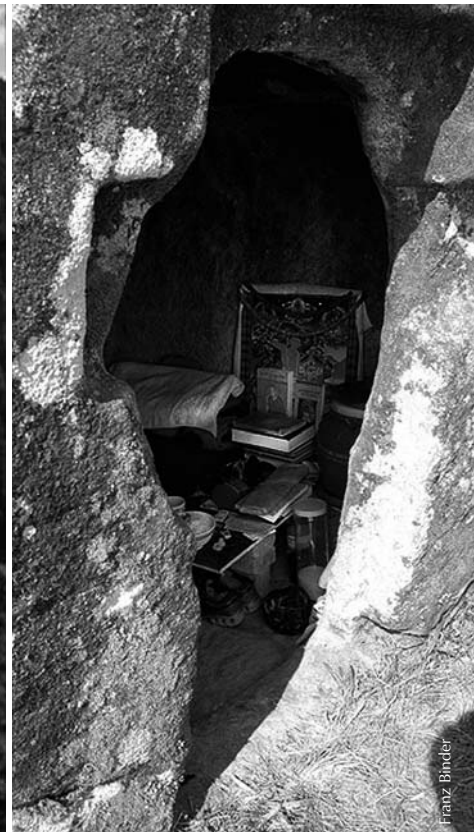
Bilder aus Einsiedeleien in den Bergen von Bhutan

„Das Glück der Genügsamkeit, das der genießt, der nach freiem Willen lebt, nichts begehrt und an niemanden gebunden ist, ist selbst für (den Gott) Indra schwer zu erlangen.“