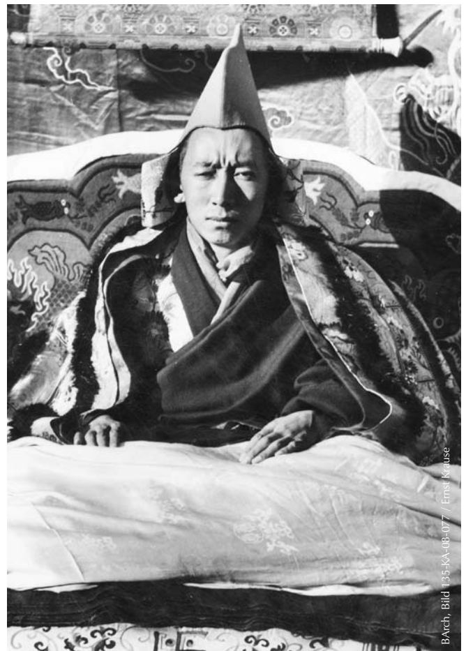
Der Regent Reting Rinpoche führte in der Zeit zwischen dem 13. und dem 14. Dalai Lama, also während der Schäfer-Expedition, die Regierungsgeschäfte in Tibet.

Die absurdesten derartigen Theorien stammen von Autoren, die dem Kreis des alten General Erich Ludendorff nahe standen. Sie beschuldigten die Tibeter, in Europa die geistige Macht an sich reißen zu wollen. So habe der Dalai Lama „den nach Vermessenheit klingenden, hochtrabenden Titel ‚Geheimer Herrscher der Welt‘“. Und die Völker sollen „die große Gefahr erkennen, die ihnen vom ‚Dache der Welt‘ mehr denn je droht.“ Viele Nationalsozialisten sahen offenbar in Tibet eine Bedrohung für das Abendland.