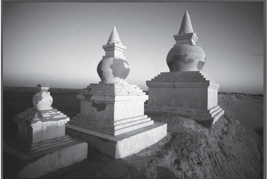
Auch heute noch sind Spuren des Buddhismus entlang der alten Seidenstraße sichtbar: das Kloster Alashan Miao in der Wüste Gobi, die Stüpas von Khara Koto, der „Schwarzen Stadt“, die bereits Marco Polo erwähnte, und der Tempel von Xian im heutigen China.