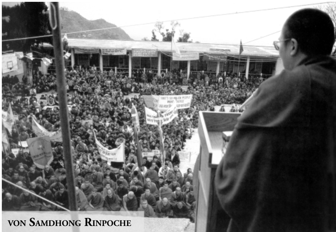
VON SAMDHONG RINPOCHE

Henri Bancaud (aus „Tibet im Exil“, Herder 1995)