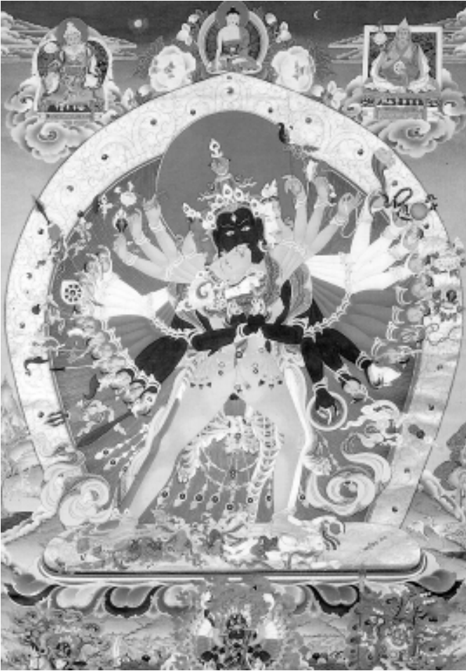
Rime Jangchub Choeling